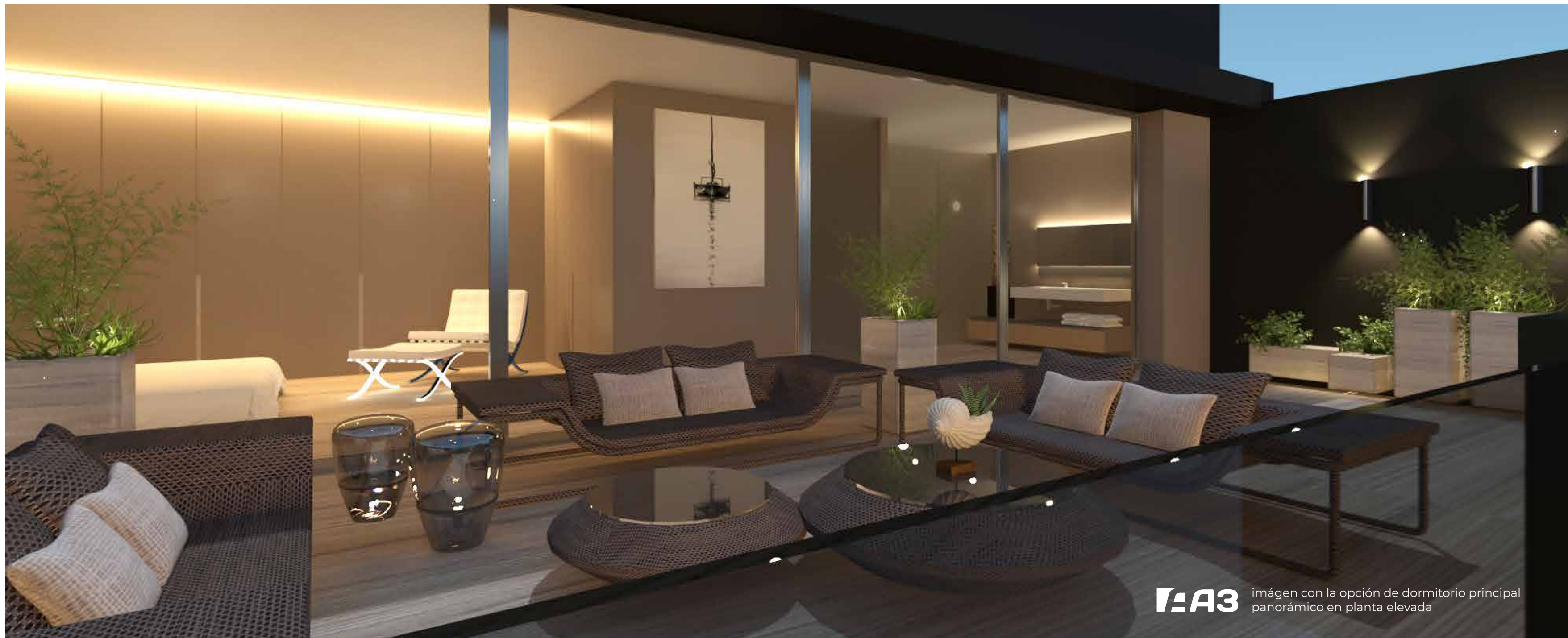
A3 imagen con la opción de dormitorio principal panorámico en planta elevada